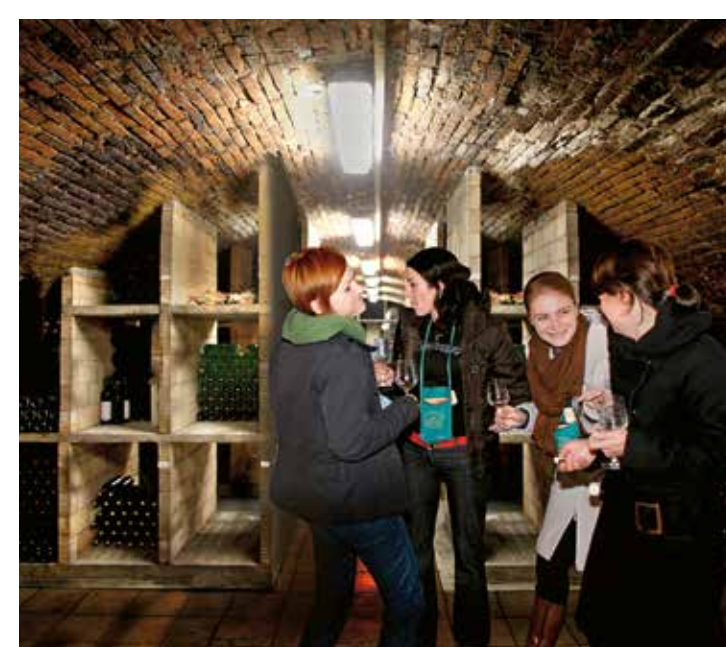
PIVNICA PRI FARSKOM KOSTOLE V PEZINKU