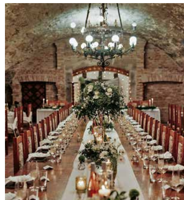
PIVNICA POD FUGGEROVÝM DOMOM V ČASTEJ