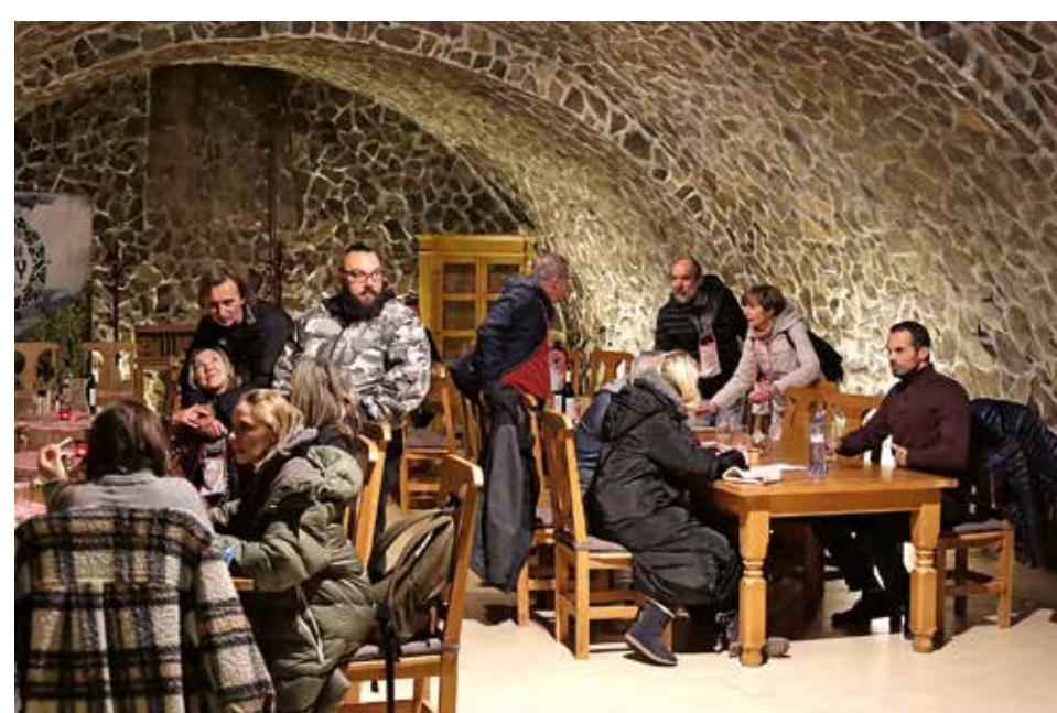
PIVNICA PRI KOSTOLE SVÄTEJ TROJICE VO SVÄTOM JURE