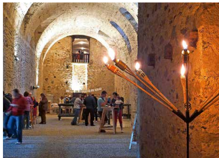
PIVNICE HRADU ČERVENÝ KAMEŇ