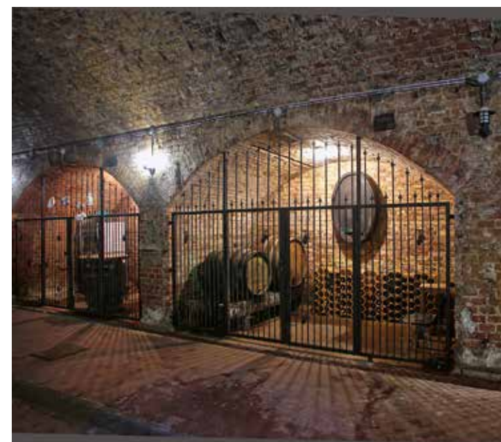
PIVNICA POD NEMECKÝM KULTÚRNYM DOMOM V RAČI