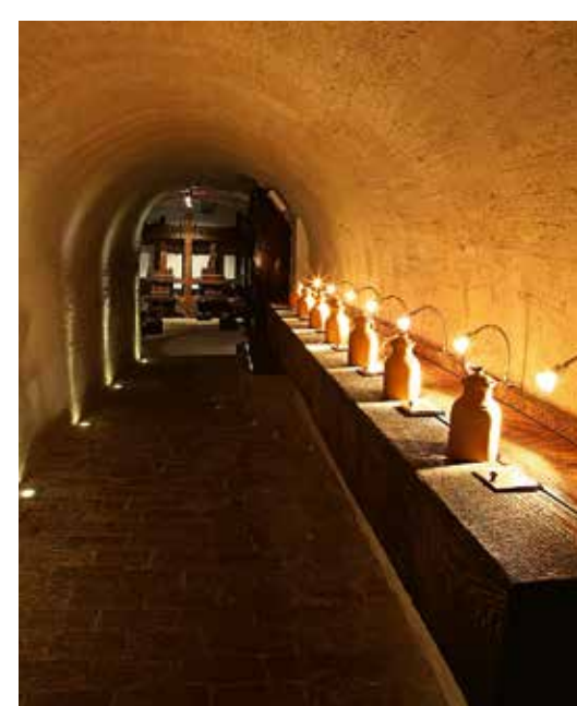
PIVNICA MALOKARPATSKÉHO MÚZEA V PEZINKU