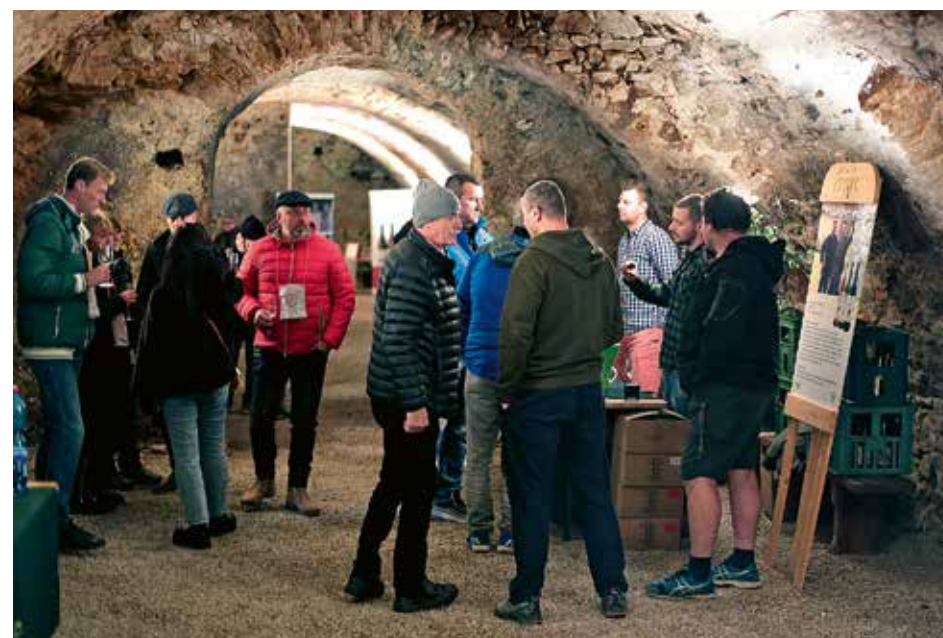
PIVNICA POD STAROU RADNICOU V MODRE