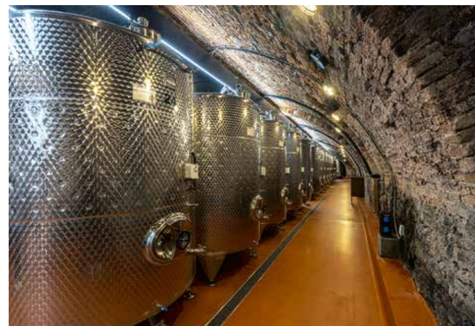
PIVNICA POD PÁLFIOVSKÝM KAŠTIEĽOM VO SVÄTOM JURE