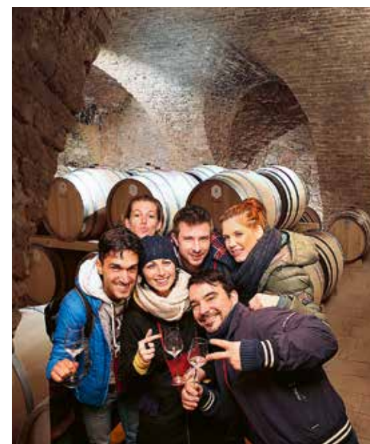
PIVNICA ZÁMOCKÉHO VINÁRSTVA V PEZINKU